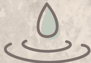
Espejo de Agua