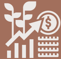
Zona de alta plusvalía