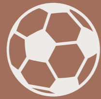
Cancha de fútbol