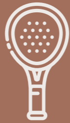
Canchas de pádel