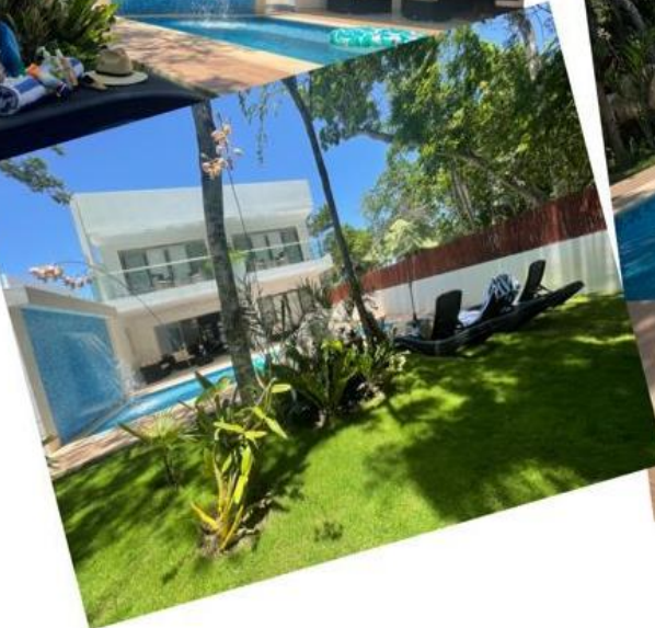
ÁREA DE PISCINA / SWIMMING POOL AREA