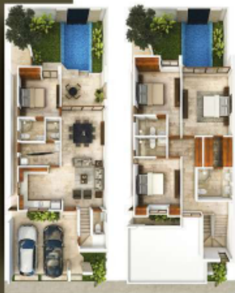
PLANTA MODELOS AQUA

*Modelo CELESTE no cuenta con balcón en recámara principal