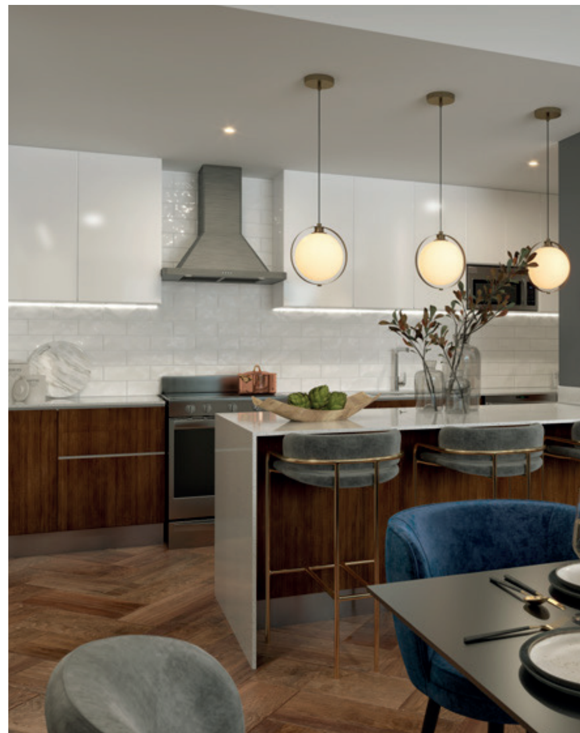
COCINA APARTAMENTO TIPO A Y D

Tanto en las áreas comunes, como dentro de tu nuevo hogar, encontrarás espacios y detalles atemporales, elegantes y diseñados para el confort.