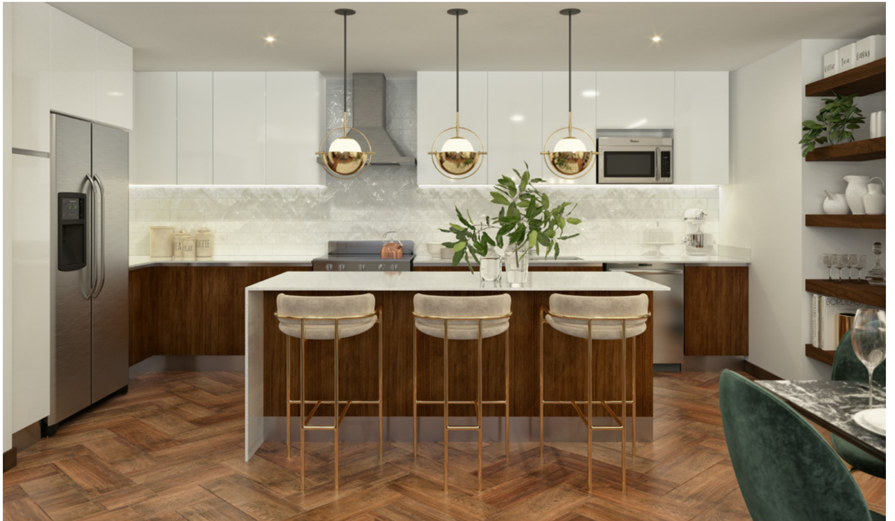
COCINA APARTAMENTO TIPO B Y C