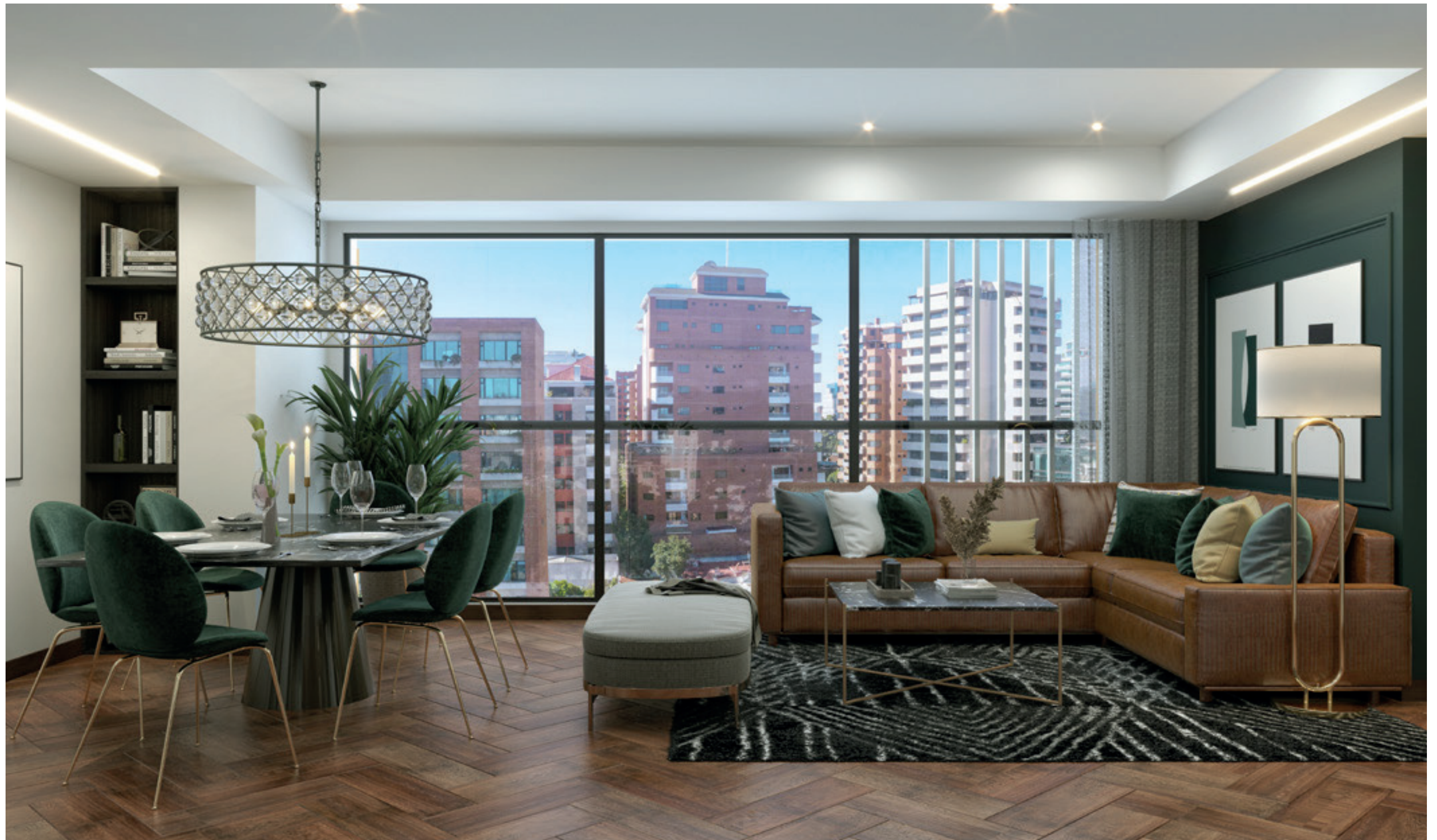
ÁREA SOCIAL APARTAMENTO TIPO B Y C