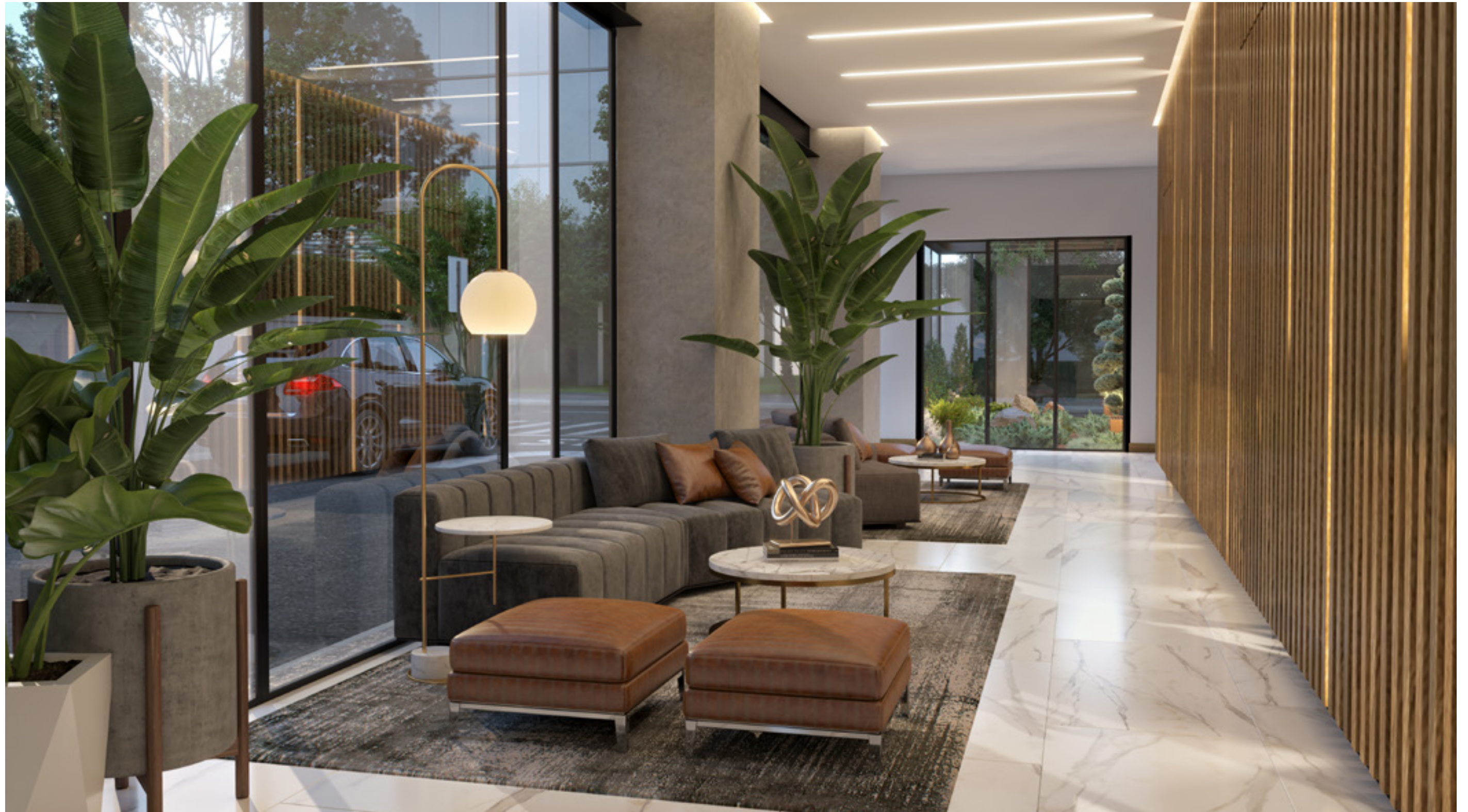
Sala de espera