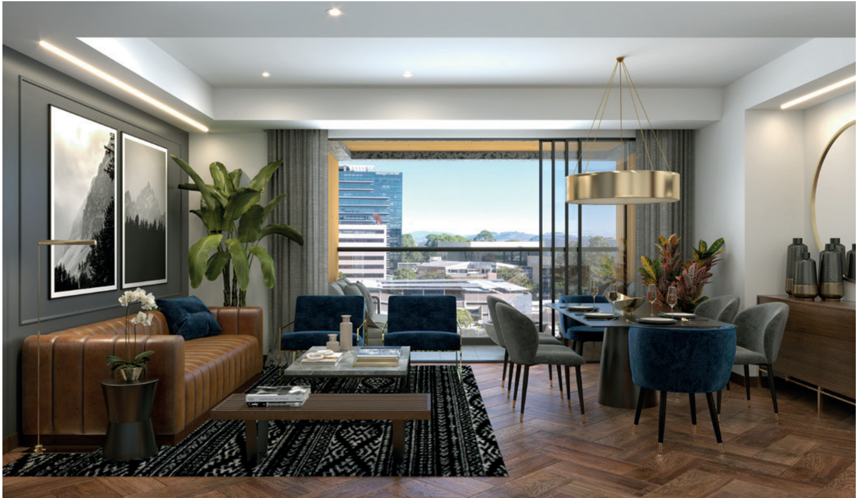
ÁREA SOCIAL APARTAMENTO TIPO A Y D