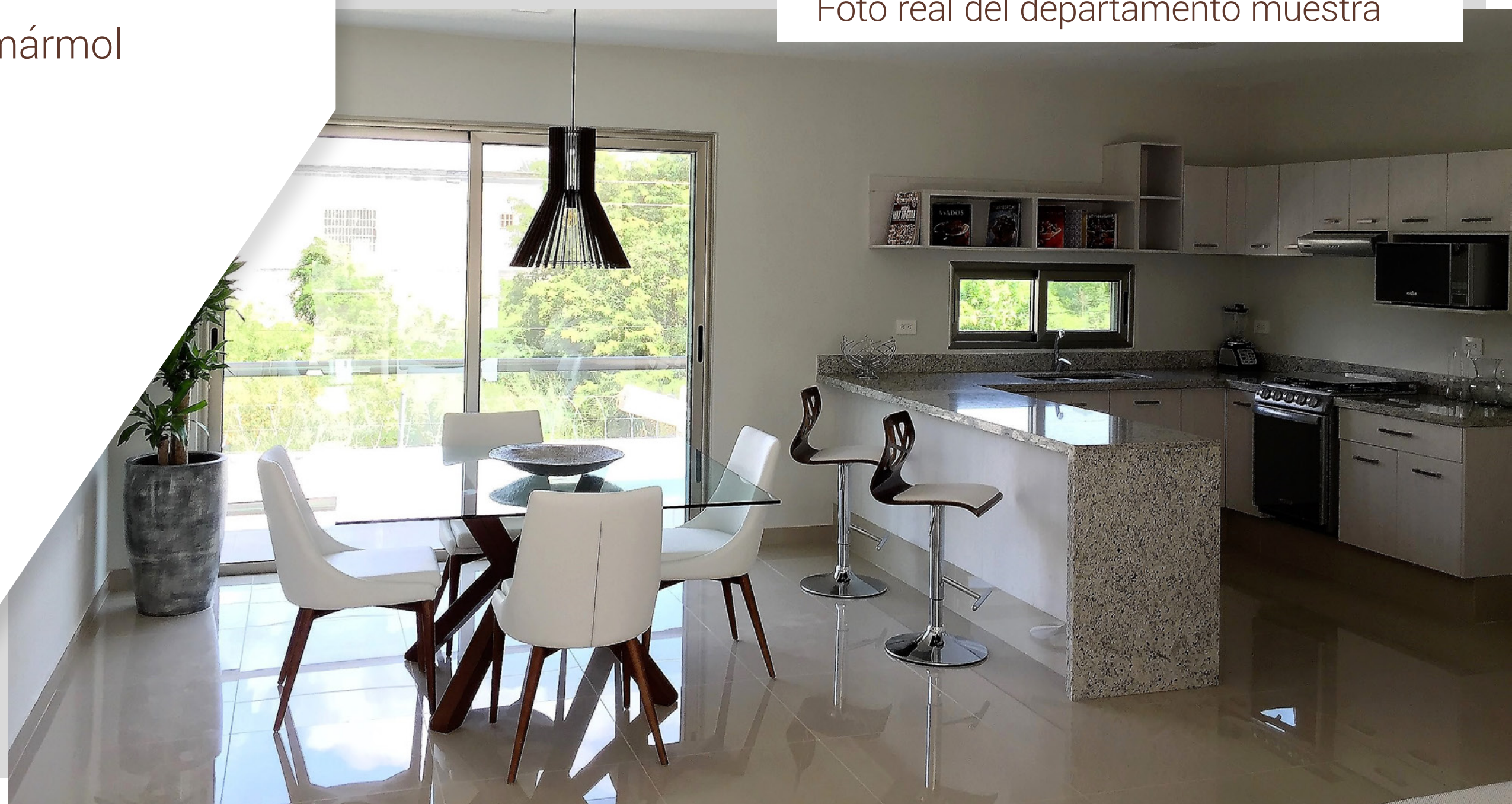
Foto real del departamento muestra