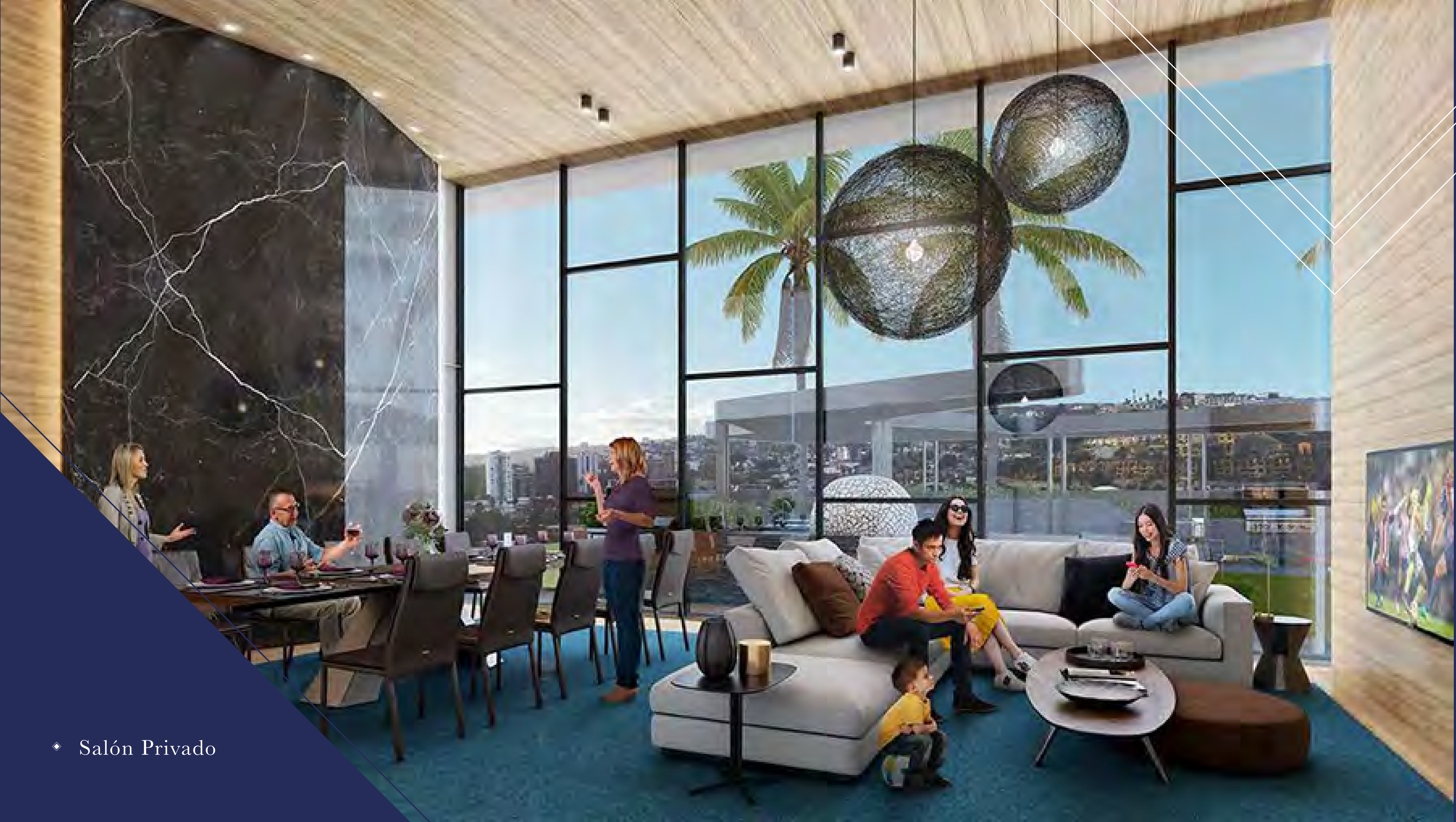
◆ Salón Privado