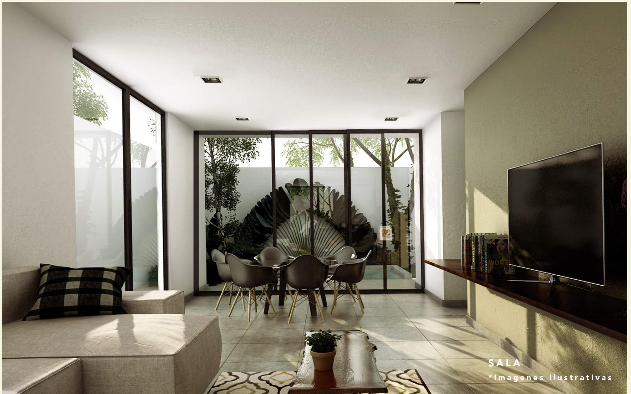
SALA *Imágenes ilustrativas