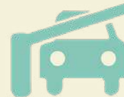
Caseta de acceso