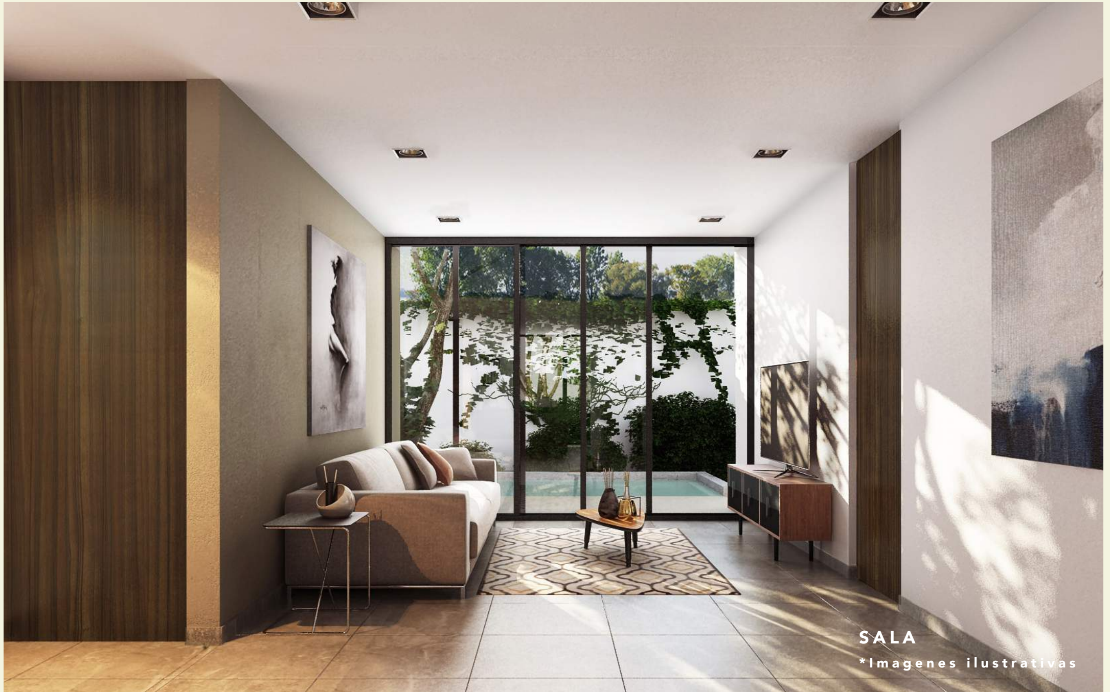
SALA *Imágenes ilustrativas