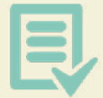
Régimen de condominio