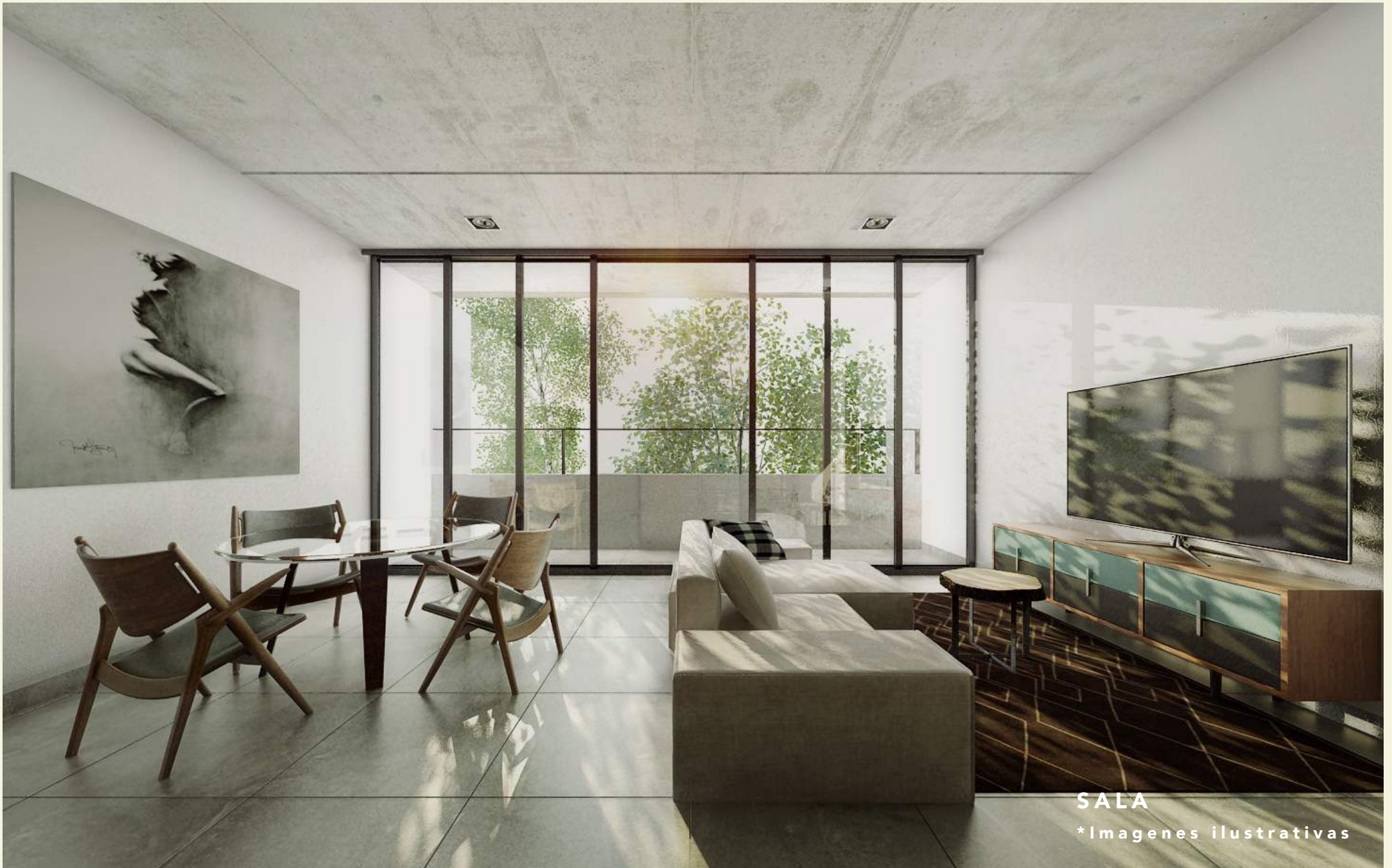
SALA *Imágenes ilustrativas