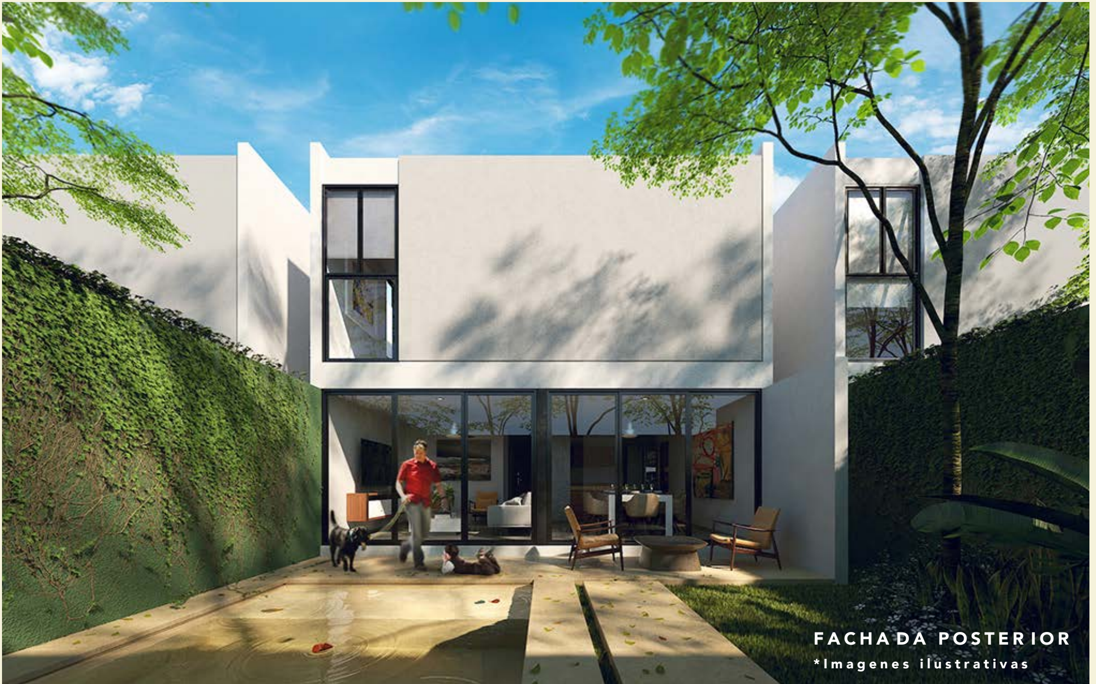
FACHADA POSTERIOR *Imágenes ilustrativas