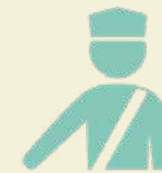
Seguridad 24 hrs.