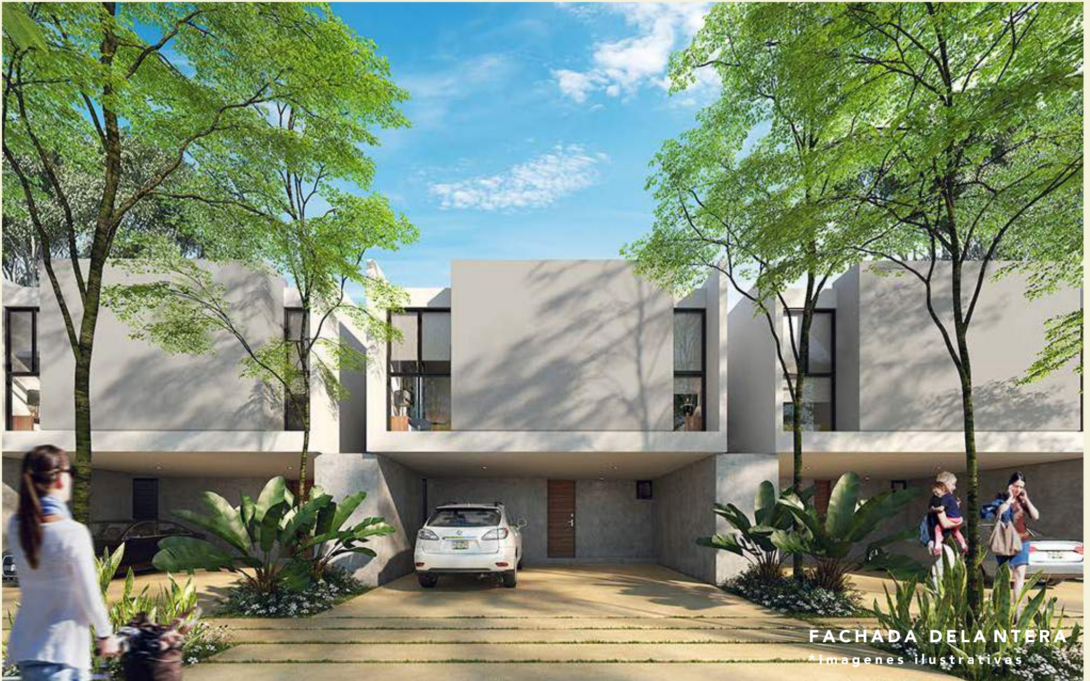
FACHADA DELANTERA *Imágenes ilustrativas