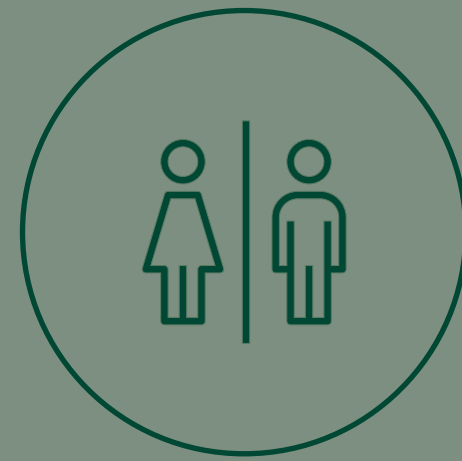
BAÑOS H & M