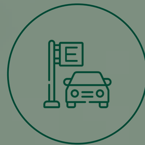
ESTACIONAMIENTO DE VISITAS