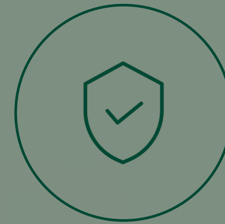
CASETA DE VIGILANCIA Y PORTÓN DE SEGURIDAD