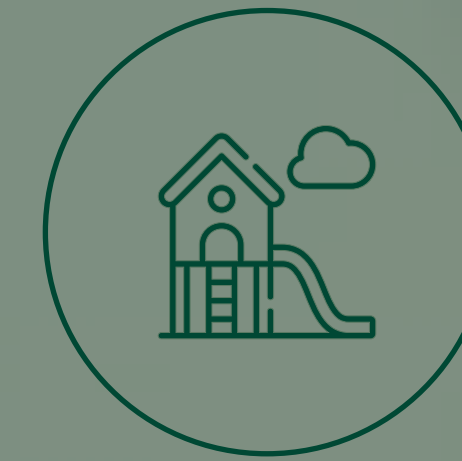
ÁREA DE JUEGOS