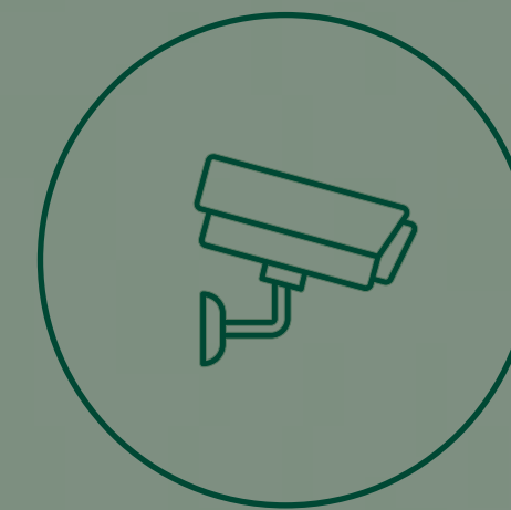
CÁMARAS DE SEGURIDAD