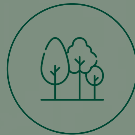
BANQUETAS INTERIORES ARBOLADAS Y ACCESO PEATONAL