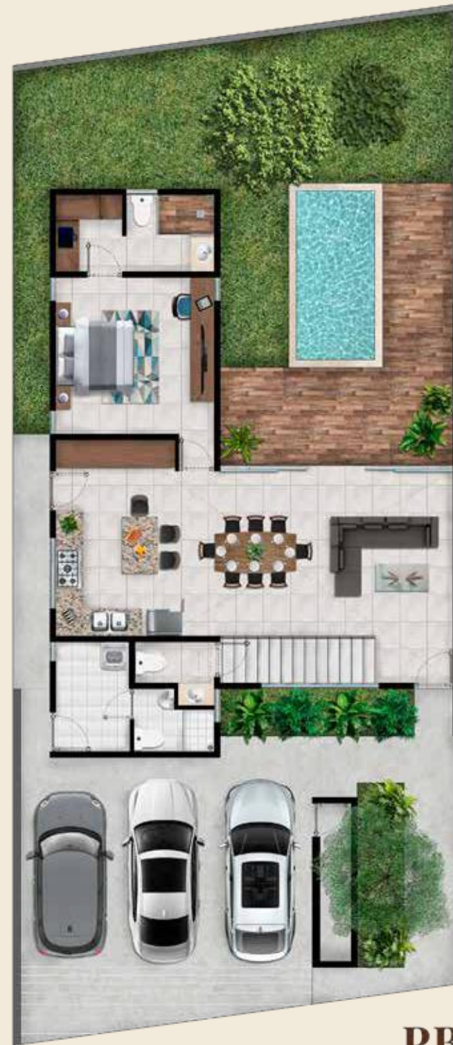
PB 160 M 2