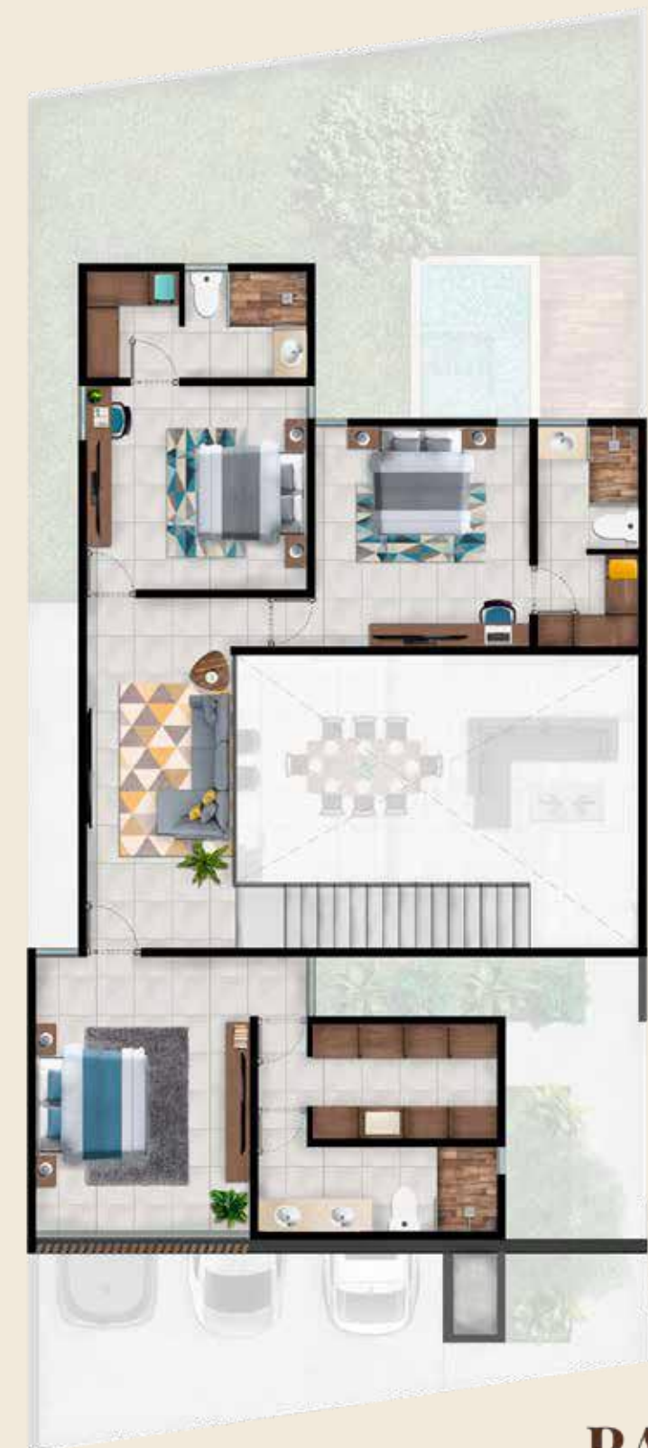
PA 119 M 2

Esta imagen es un render ilustrativo. Sujeto a cambios sin previo aviso.