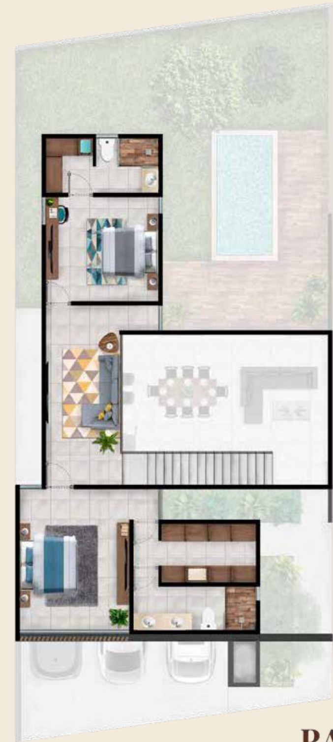
PA 92 M 2