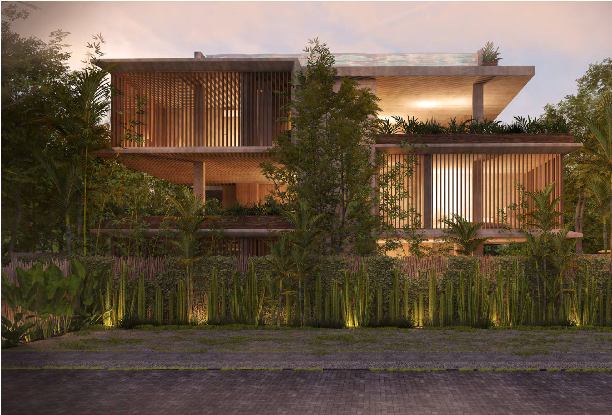
Images shown are for illustration purposes only and is subject to change.