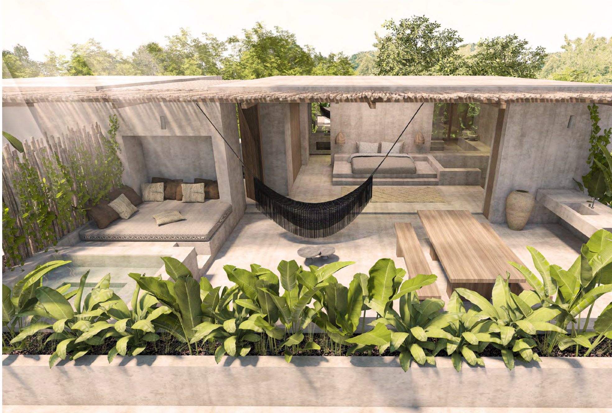
Images shown are for illustration purposes only and is subject to change.