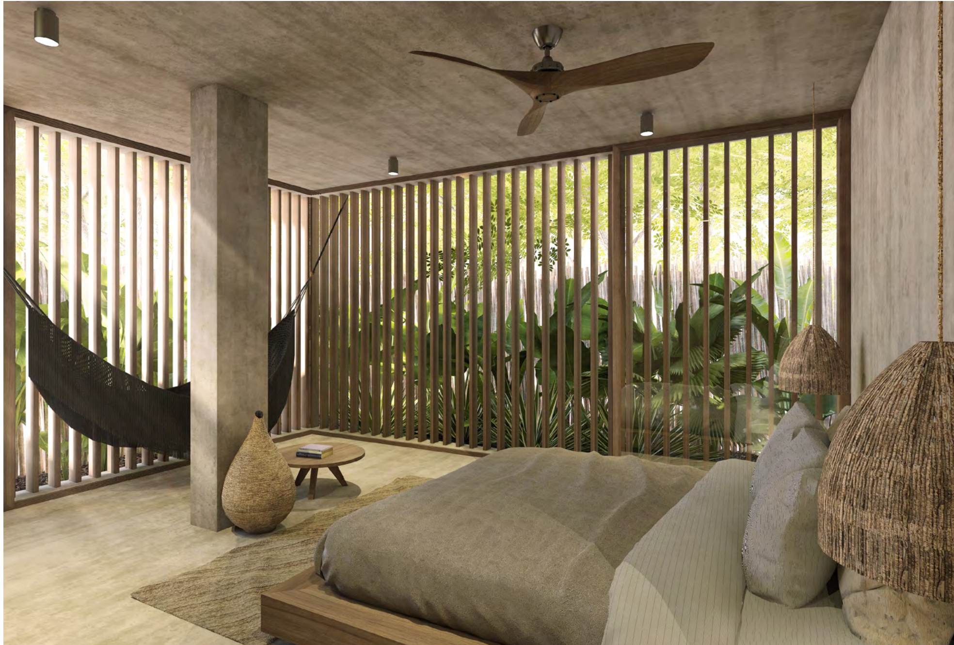
Images shown are for illustration purposes only and is subject to change.