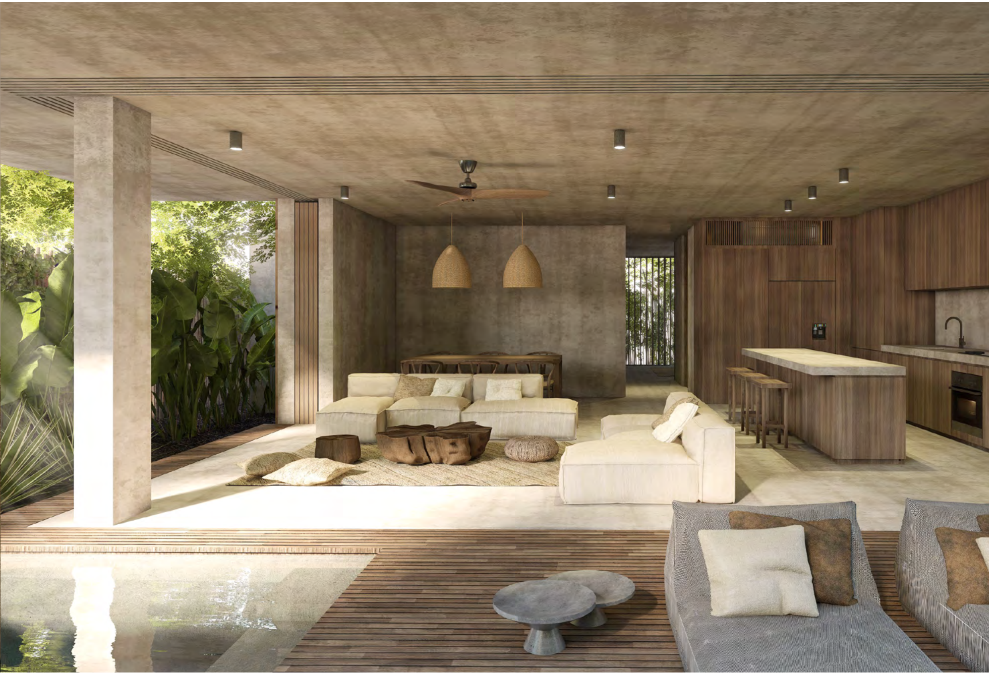
Images shown are for illustration purposes only and is subject to change.