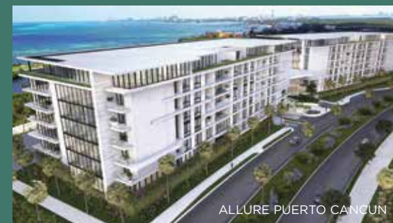
ALLURE PUERTO CANCUN