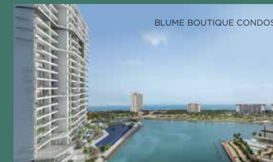
BLUME BOUTIQUE CONDOS