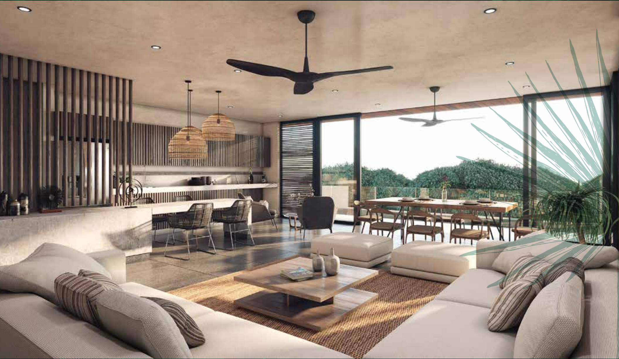
PENTHOUSE LIVING ROOM