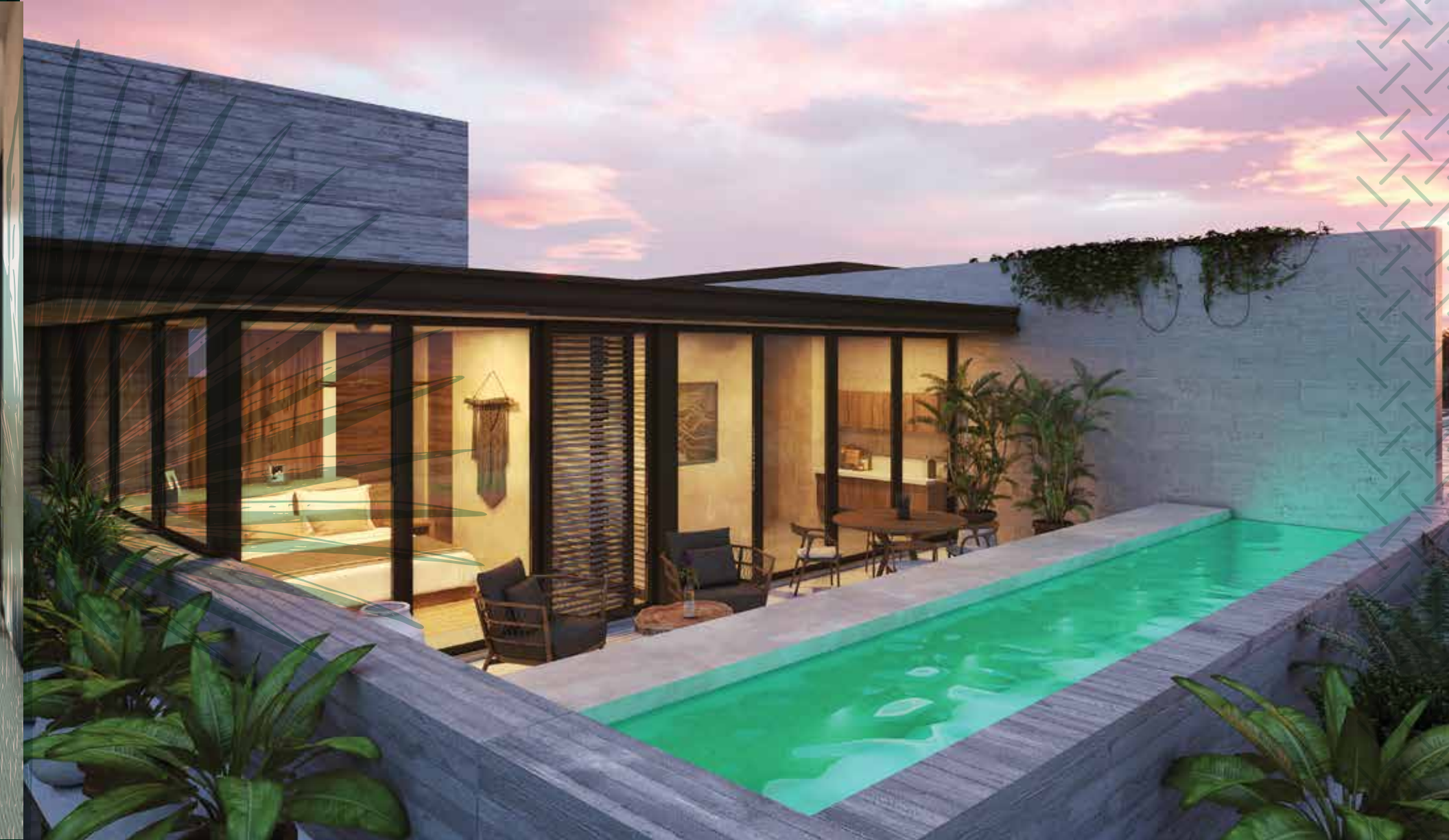
PENTHOUSE ROOFGARDEN, POOL & MASTER BEDROOM