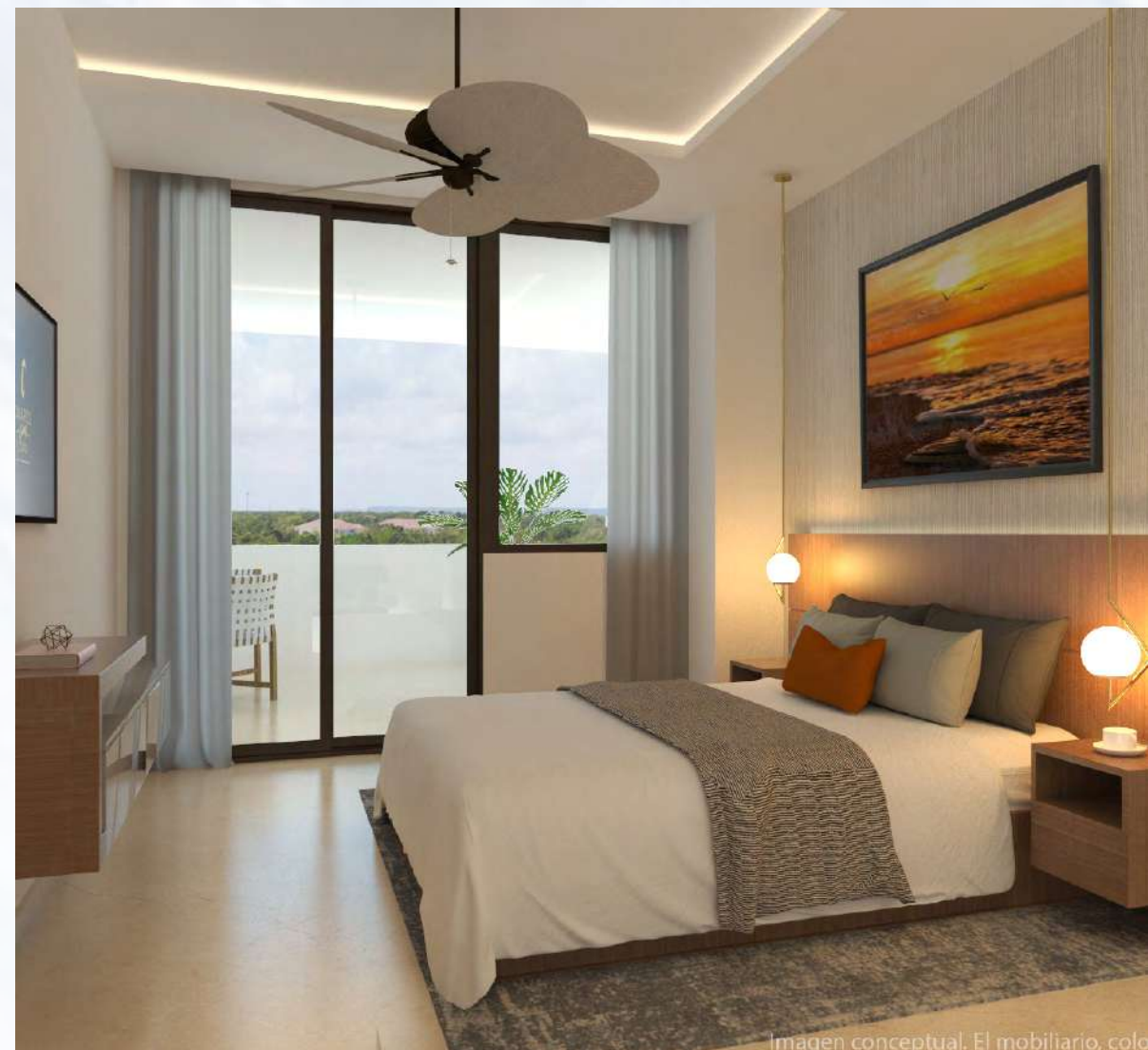
Imagen conceptual. El mobiliario, color