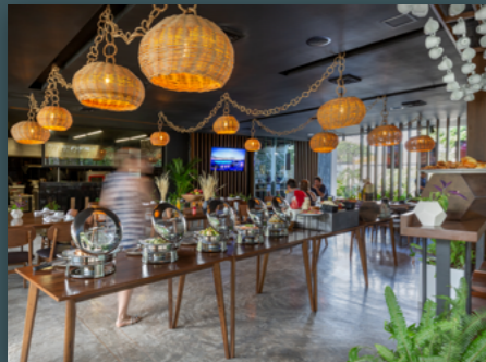
Restaurant (Central Park)