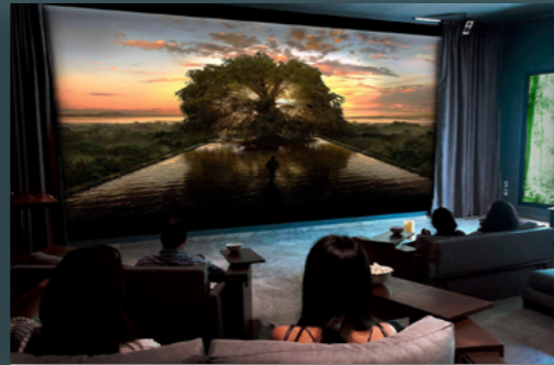
Jungle Bar &amp; Movie Lounge