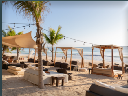
Los Amigos Beach Club