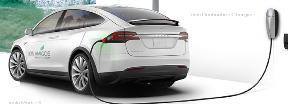
Tesla Model X