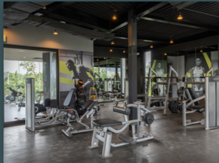
Los Amigos Gym