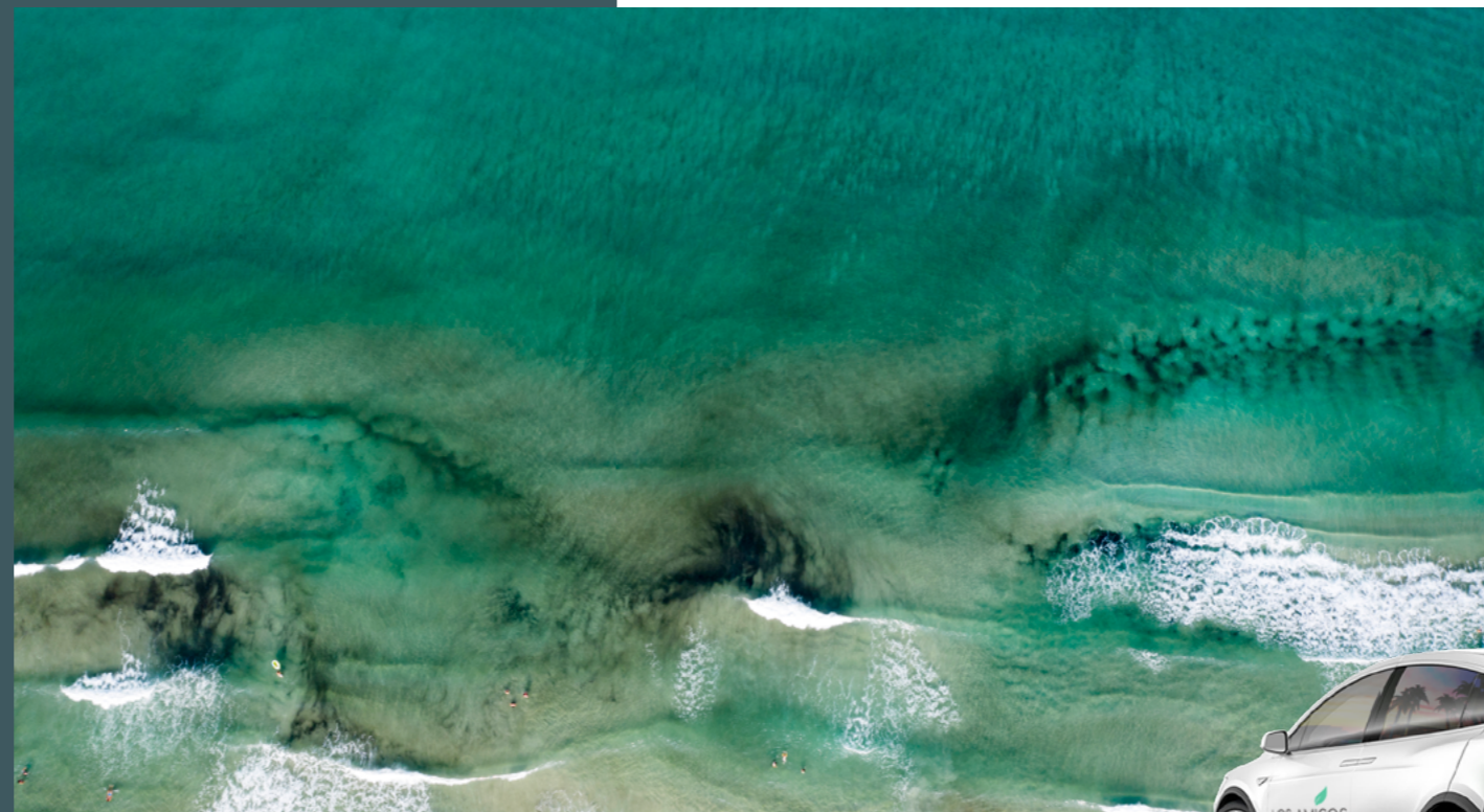
Turbina eólica residencial vertical