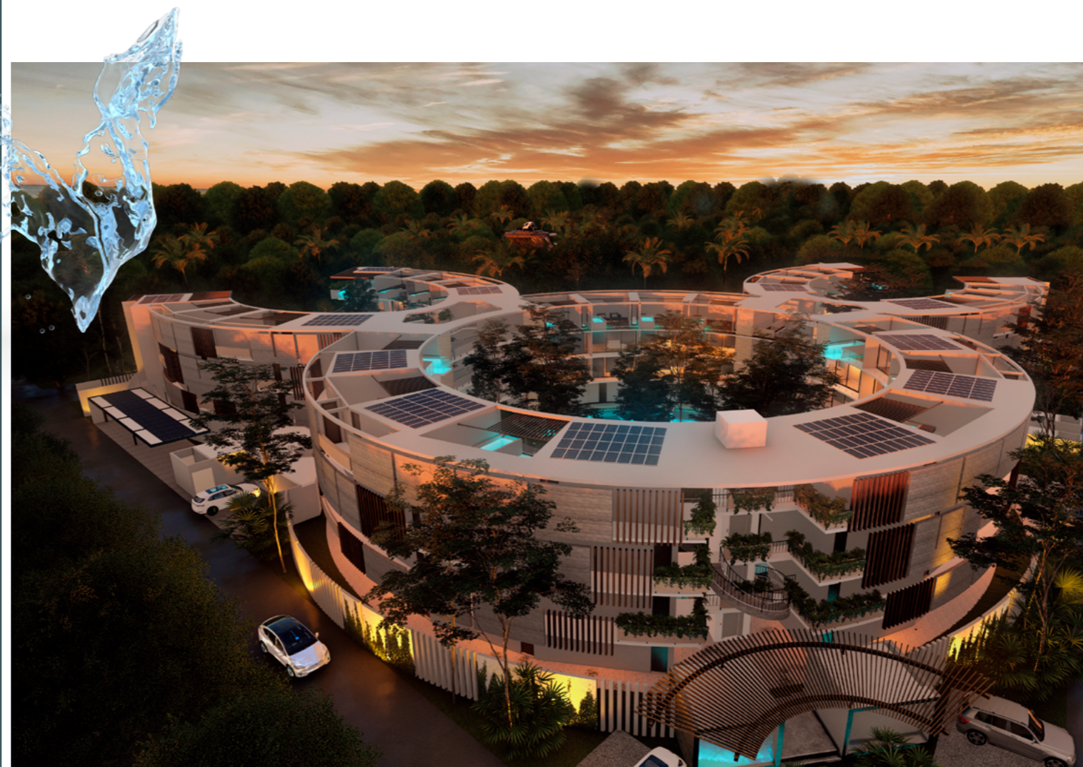
Abraza la vida de la jungla moderna en el espíritu atemporal de Tulum.

La naturaleza juega un papel importante en nuestros diseños y planificación. El agua es el elemento elegido de este proyecto representado con los ríos artificiales que se interconectan en toda la propiedad. Enclavado en la jungla, hasta el 60% de la vegetación se conservará y utilizará como parte de la huella de la propiedad.