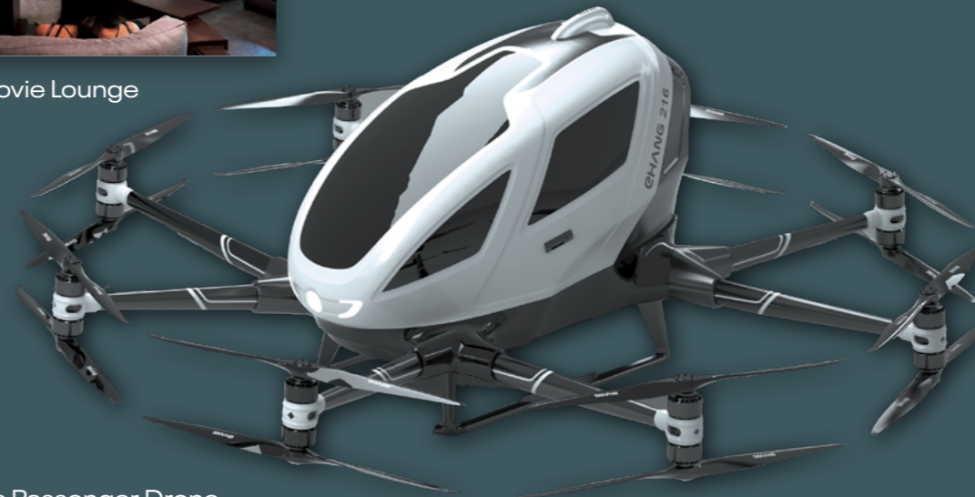
Ehang 216 Autonomous Passenger Drone