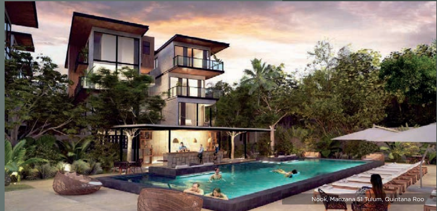
Nook, Manzana 51 Tulum, Quintana Roo

En la Riviera Maya, Niz + Chauvet Arquitectos ha diseñado conocidos hoteles como el Thomson Hotel Downtown, el Mandala Hotel & Spa y el Paradisus by Melia Hotel. Mientras que en la Ciudad de México, uno de sus proyectos más destacados es el hotel Live Aqua Bosques.