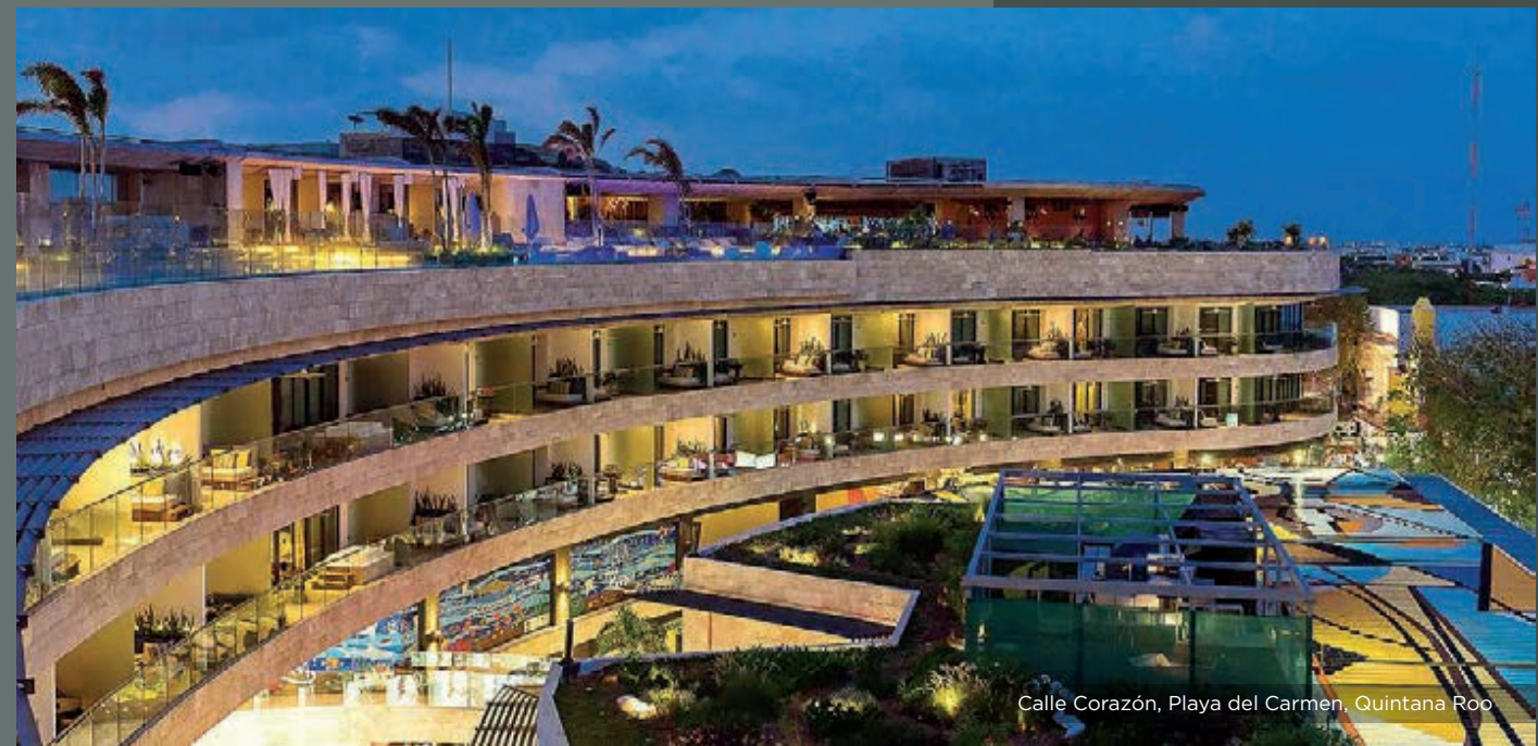
Calle Corazón, Playa del Carmen, Quintana Roo