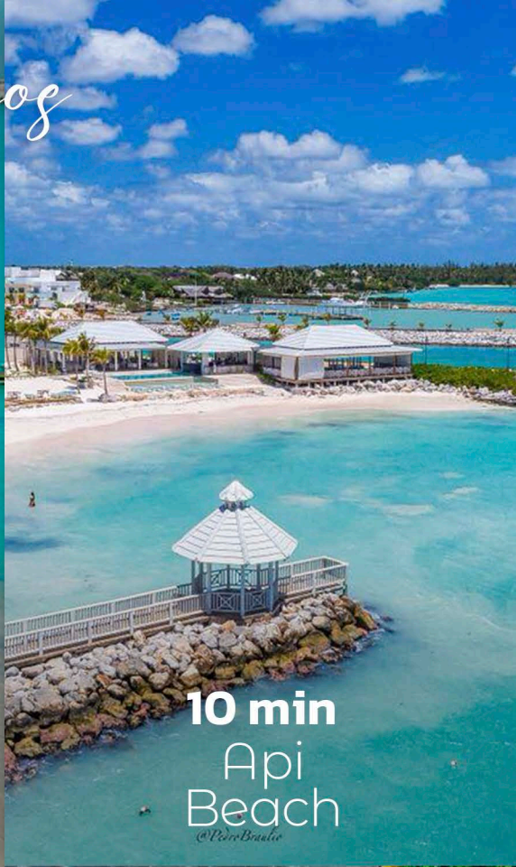
10 min Api Beach