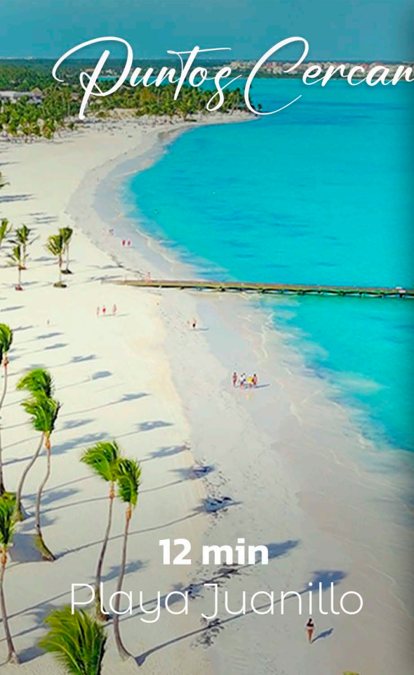
12 min Playa Juanillo