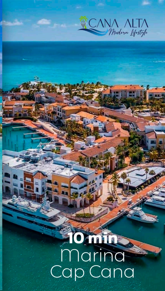
10 min Marina Cap Cana