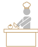
Barra de ALIMENTOS