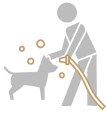
Área de lavado PARA MASCOTAS