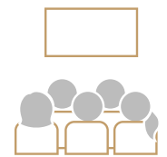
Cuarto de PROYECCIÓN