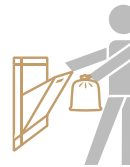
Ducto de BASURA