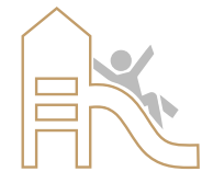
Zona de JUEGO