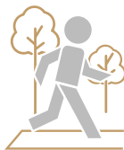
Pista de JOGGING