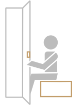
Baños con SAUNA Y VESTIDORES