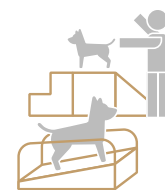
Gimnasio PARA PERROS