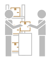
Recepción para E-COMMERCE