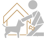
Guardería DE MASCOTAS