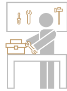
Cuarto de HERRAMIENTAS