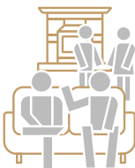
Roof Top LOUNGE