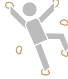
Muro DE ESCALAR