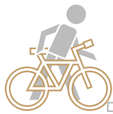
Área de BICICLETAS