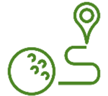
16 Campos de Golf