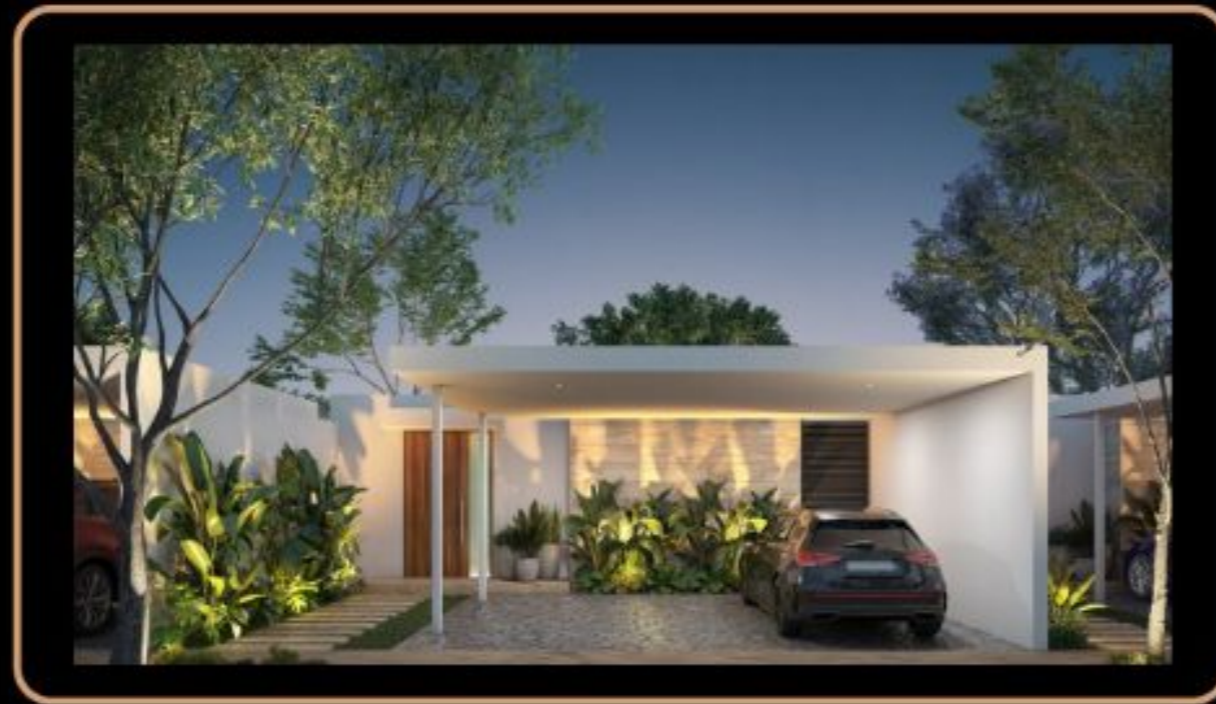
ONE FLOOR LIMITED