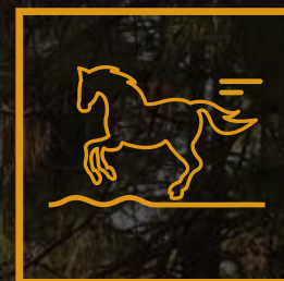
Senderos para Cabalgata