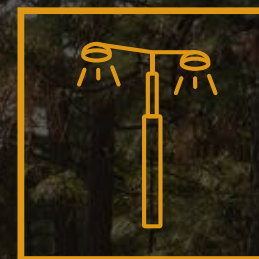
Iluminación Av. Principal