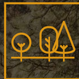
Extensas Áreas Verdes