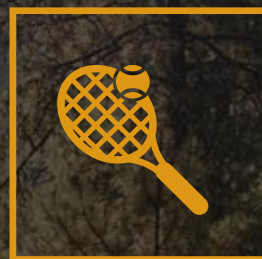
Canchas de Tenis Proximamente*