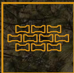
Calles Empedradas con Adoquín