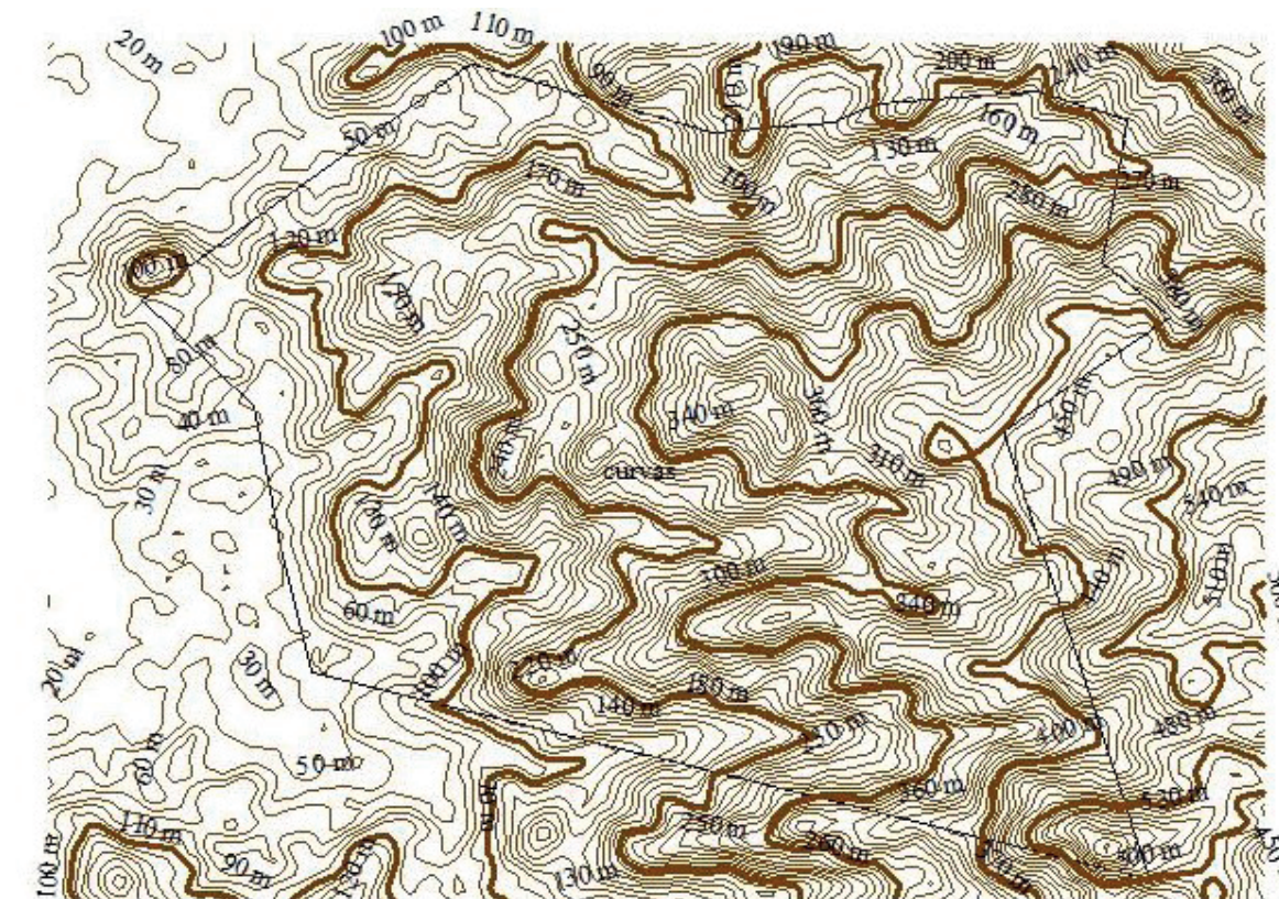
CURVA DE NIVEL