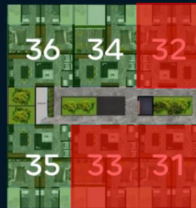
Segundo nivel (3° Piso)