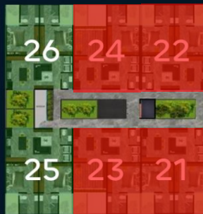
Primer nivel (2° Piso)