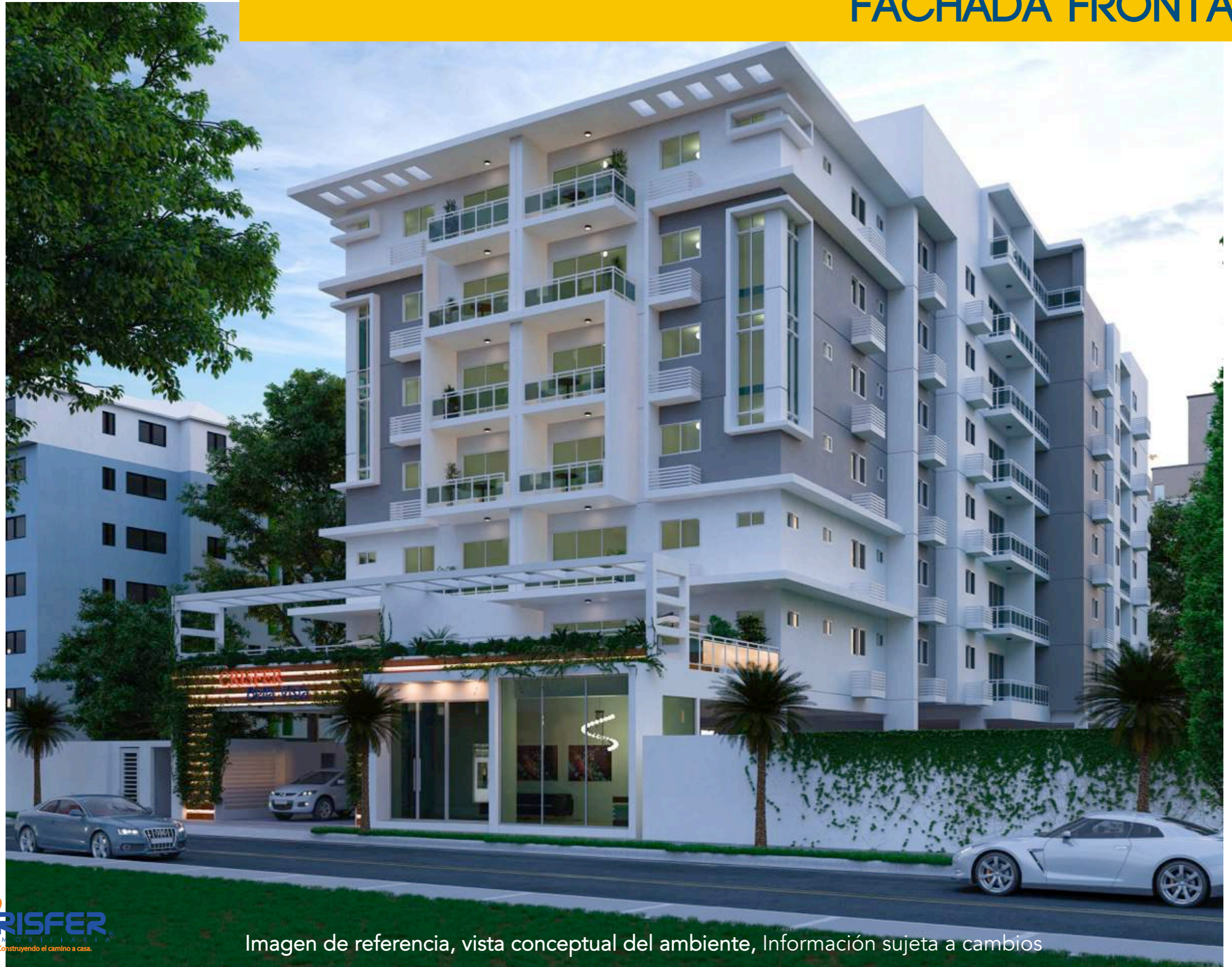
Imagen de referencia, vista conceptual del ambiente, Información sujeta a cambios