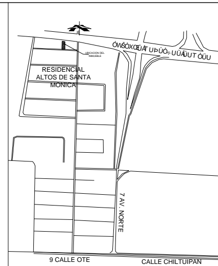
ESQUEMA DE UBICACION SIN ESCALA